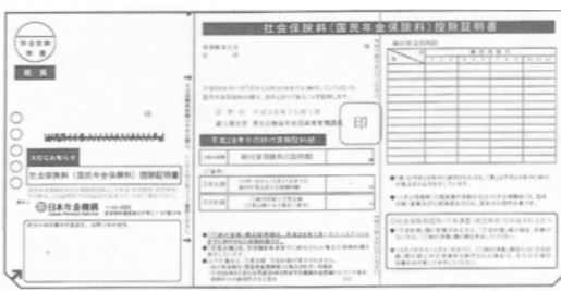
※写真は平成28年度版です。

確定申告等の手続きの際にこの証明書や領収書等が必要ですので、申告を行うまで、大切に保管してください。