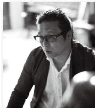
現代美術家 ▶ 大巻伸嗣氏