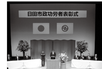
☎総務課秘書係 ☎8200（市役所4階）