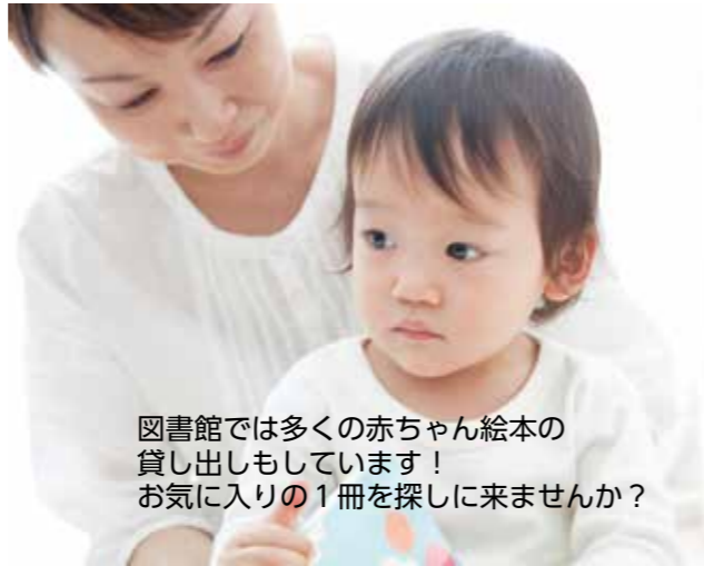
図書館では多くの赤ちゃん絵本の貸し出しもしています！ お気に入りの1冊を探しに来ませんか？

読み聞かせを始めるのに良い月齢というのはありません。大切なのは、絵本を通した「語りかけ」と「気持ちのキャッチボール」をすること。まずは、簡単な絵本から始めてみましょう。最初は反応がなく、見ていただけということもありますが、続けていくうちに絵を触ったり、お気に入りの音をまねしたりと、様々な表情を見せるようになります。