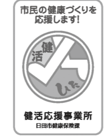
▲応援事業所ステッカー

健活ポイントカードを市内の健活応援事業所で提示すると事業所独自のサービスが受けられます。