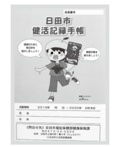
▲リニューアルした日田市健活記録手帳