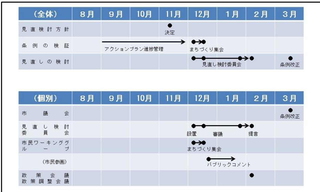
【日田市自治基本条例 検証・見直し検討スケジュール】