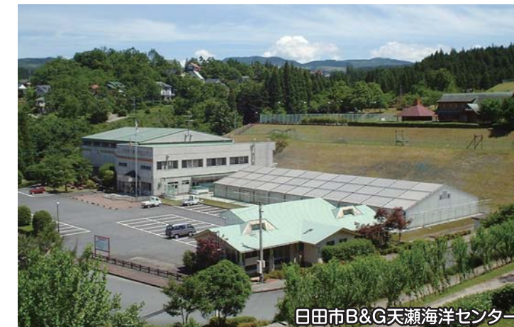
日田市B&G天瀬海洋センター

天瀬町の天ヶ瀬温泉街の近くに位置し、陸上競技、サッカー、ソフトボール、軟式野球、グラウンドゴルフ等のスポーツ全般に利用可能な施設です。