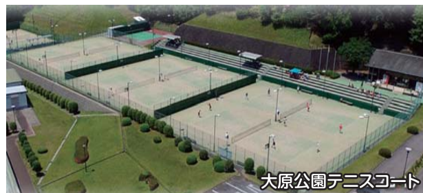
大原公園テニスコート