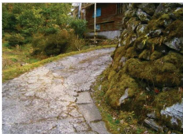
物件までの進入路（最小幅2m30cm）