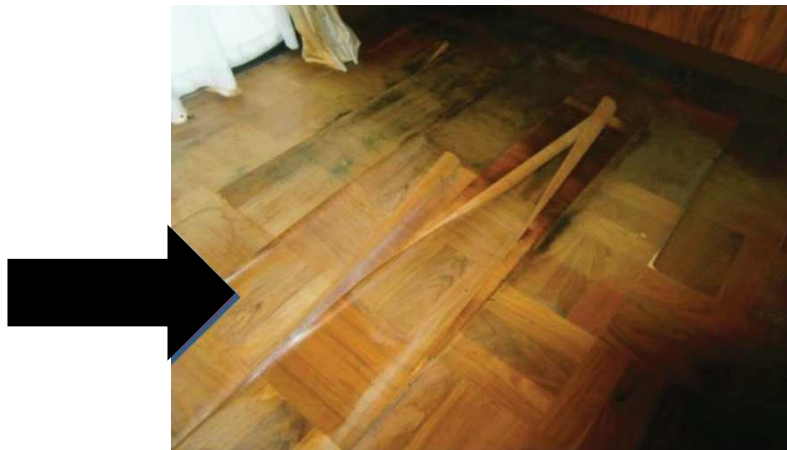
要補修箇所（雨漏り下床面）