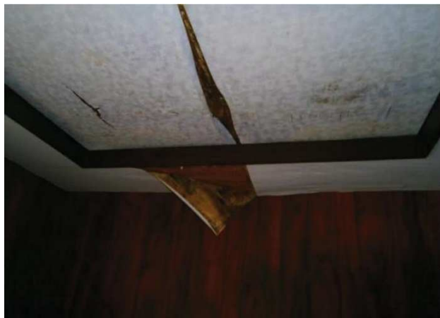
要補修箇所（天井 雨漏り）