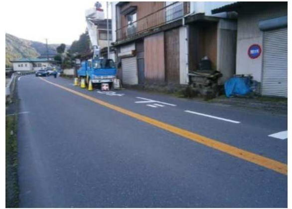
前面道路 (国道212号線)