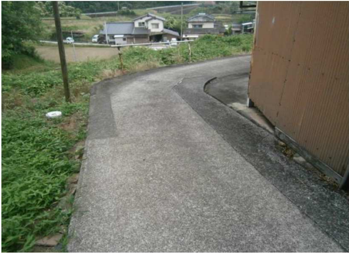
物件までの進入路（最小幅員2.30m）