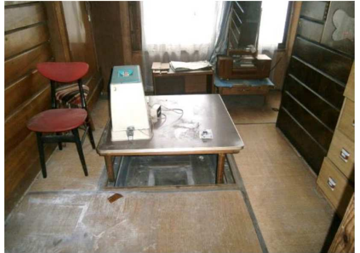
掘こたつのある和室