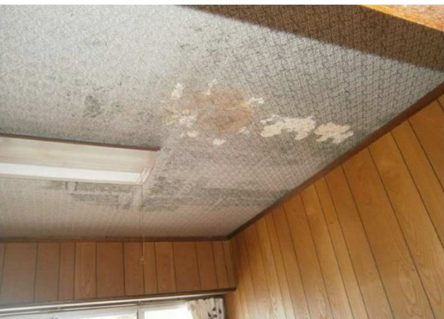
補修箇所：洋室の天井