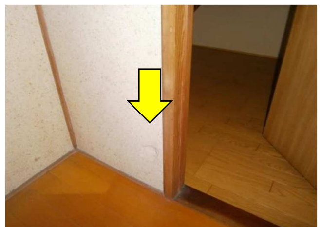
補修箇所：トイレの壁