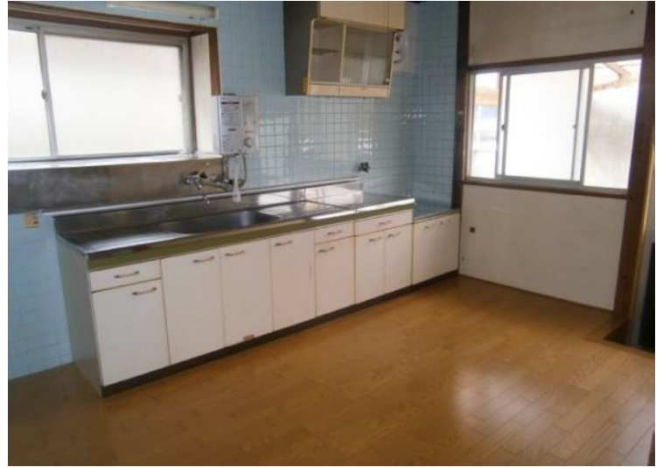
台所：給湯器あり ※台所の床張替（平成30年4月）