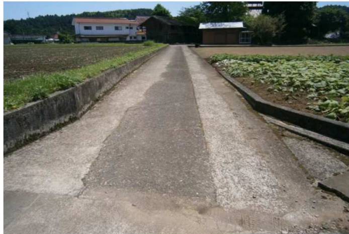
前面道路 幅員 約2m