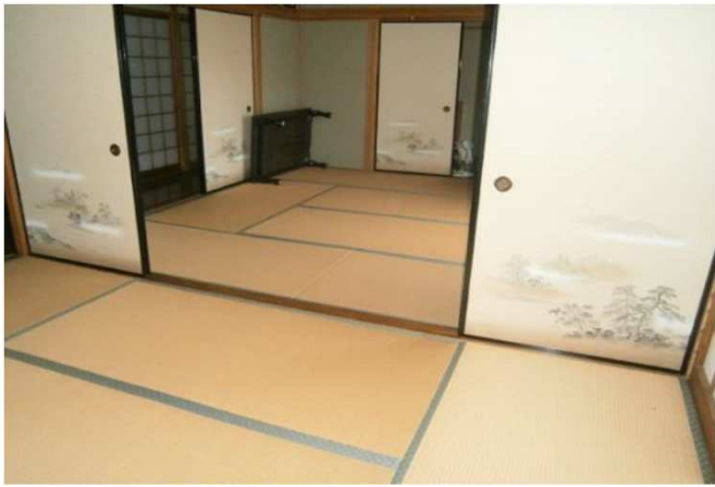
1階二間続きの和室