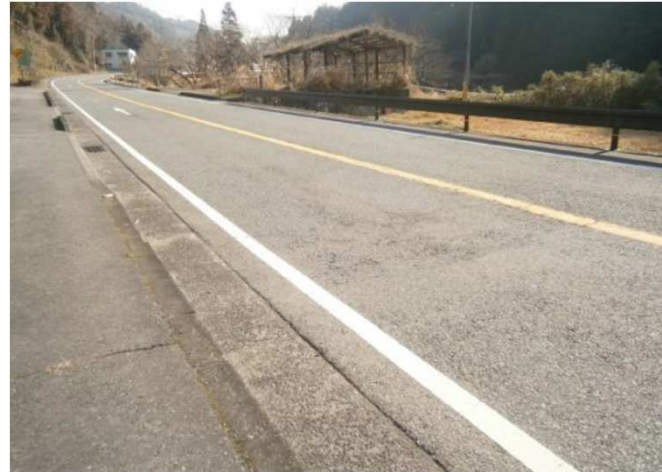
前面道路・国道210号線沿い