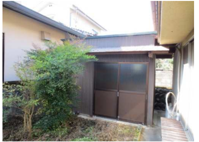
スロープ (トイレから駐車場まで)