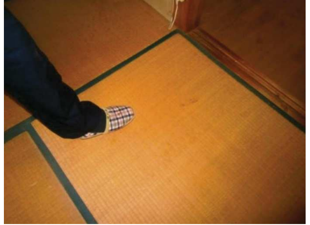
要補修（波打ちあり）