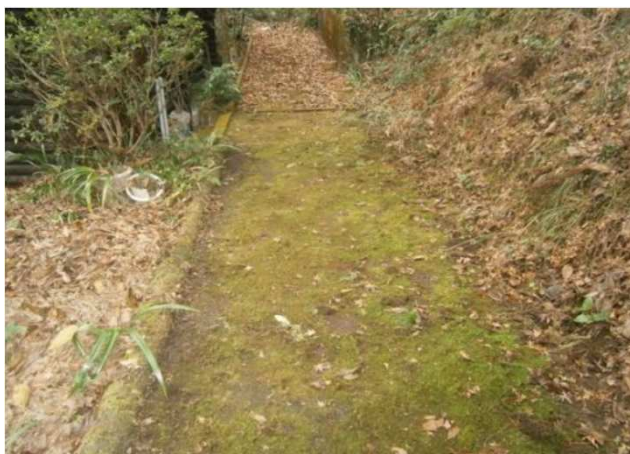
前面道路（共有地）幅員2m