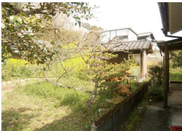
物件横の宅地（奥に和式のトイレあり）