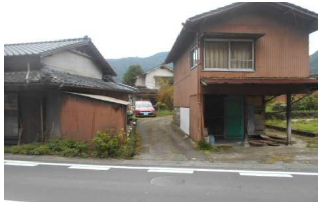
国道212号線からの進入路 (2m強)