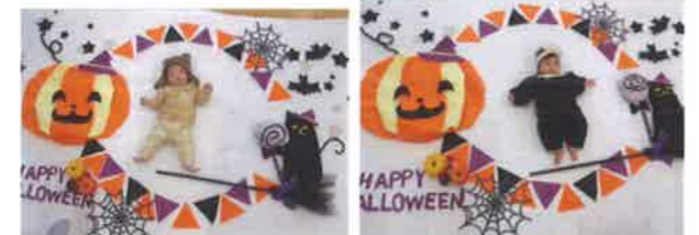
ハロウィンの時期に行ったお昼寝アート

〇お子さまの身長・体重はいつでも計れますので声をかけてください。 〇ひのくま子育て支援センターは初めてパパ、ママになる方も利用できます。