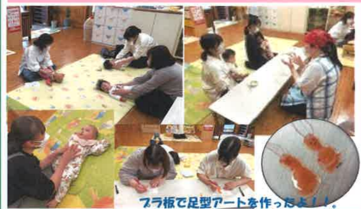
フラ板で足型アートを作ったよ！！

〈脳の発達~脳の発達に応じて親が適切にかかわることが大切~〉 生後すぐに発達するところ・側頭派「音を聞く」能力 ・0歳から1歳くらいの赤ちゃん時代は、視野、聴覚、触覚がめざましく発達するので赤ちゃんの顔を見て話しかけ、微笑んで、たくさん抱っこしてふれあうこと、読み聞かせなどを通してたくさん言葉を聞かせることで脳もぐんぐん育っていきます。