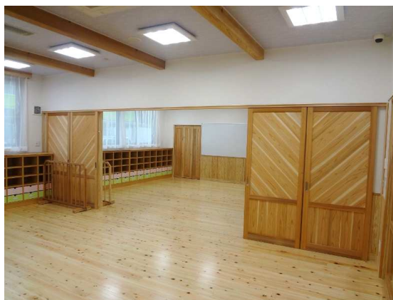
おおやまこども園