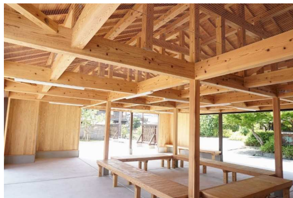
豆田まちづくり歴史交流館休憩所