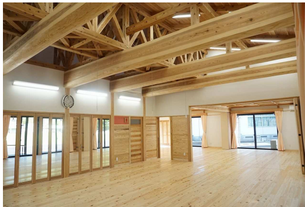
花月コミュニティセンター