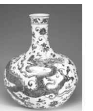
青花龍文大瓶 景德鎮窯 明時代・15世紀 国立故宮博物院蔵