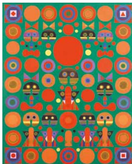
▲宇治山哲平 <華巖> 1984年