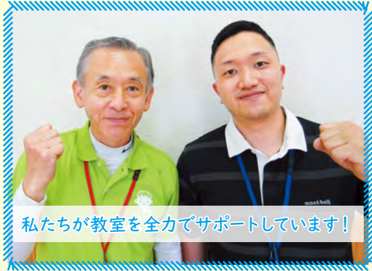
私たちが教室を全力でサポートしています!