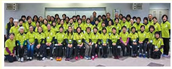
問健康保険課健康支援係 ☎243000 (ウェルピア)