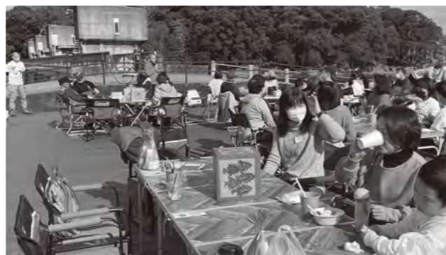
▲昨年度開催した移住者交流会の様子

問 NPO法人リエラ ☎ 080-8582-5914 M info@re-area.org ひた暮らし推進室移住促進係 ☎ 8383 (市役所6階)