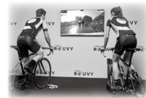
▲バーチャルサイクリング体験会(イメージ)

九州を舞台として、海外で活躍するプロチームも参加する国際自転車ロードレースです。来年の10月に第1回大会が開催され、福岡県、熊本県、大分県の3県で各ステージが行われます。大分ステージは日田市でレースが実施されますが、コースは現在、検討中です。大会当日は、交通規制を実施しますので、ご協力をお願いします。