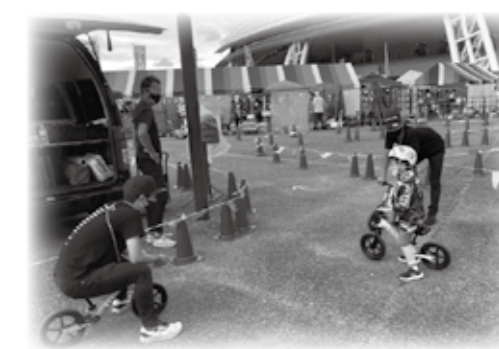
▲ストライダー体験会(イメージ)