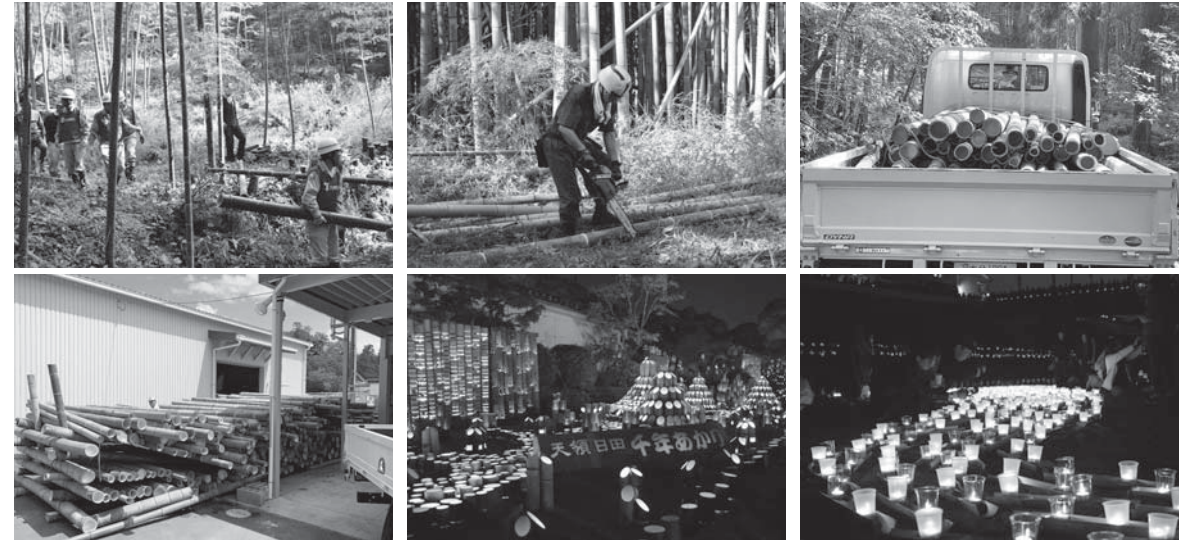
第14回千年あかりの様子/今年のオススメスポットを是非、Facebookに投稿してください!

今年も実行委員会の会議や竹伐採作業や灯籠作成など多くの方々とともに準備を行いました。