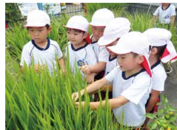
▲みくまエコクラブの活動の様子

で紹介しています。メルマガでは、季節限定プログラムや各地域の環境情報等も配信中です。