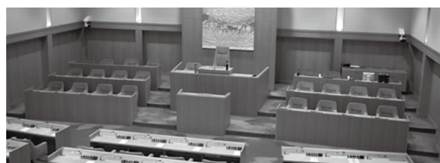
☎ 議会事務局 ☎ 8 2 1 4 (市役所3階)