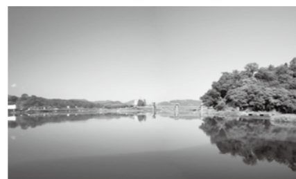
☎ 環境課水・環境係 ☎ 8 3 5 7 (市役所2階) ☎ 日田消防署危険物係 ☎ 2 2 0 4