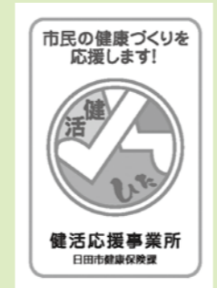
▲応援事業所ステッカー

応援事業所ステッカーがある店で、健活カードを提示すると、サービスが受けられます！是非、参加してください。