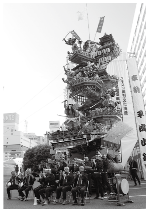
▲昨年のユネスコ無形文化遺産登録記念イベントでの平成山鉾