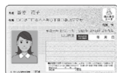
▲マイナンバーカード

※現在受け取られていないマイナンバーカードは、国の制度上、平成30年10月1日以降に廃棄しなくてはなりません。