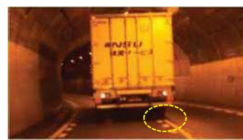
▲カーブ区間で車線逸脱