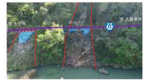
▲H28.4熊本地震による崩壊状況