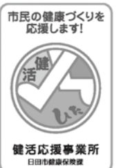
▲応援事業所ステッカー

令和元年度の登録者はポイント交換の申請と継続手続きが3月から始まっています。登録者には案内を出していますので受付期間を確認の上、ウエルピアまでお越しください。