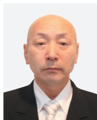
★危険業務従事者叙勲 瑞宝単光章 防衛功労

永年にわたり危険性の高い業務に従事した人に贈られる危険業務従事者叙勲が発表されました。市内では、次の人が晴れの受章に輝きました。