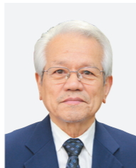
★春の叙勲 瑞宝単光章 消防功労