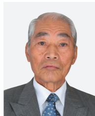
★春の叙勲 瑞宝双光章 消防功労