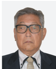
★春の叙勲 瑞宝双光章 教育功労

国家や公共のために功績のあった人に贈られる春の叙勲が発表されました。市内では、次の人々が晴れの受章に輝きました。