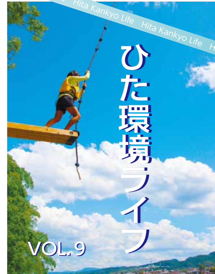
☎ 環境課生活環境係 ☎ 24208（市役所2階）

ふだんの暮らしを、びっくりするほど豊かにしてくれるオリーブの楽しみ方がまるごとわかる本。地中海沿岸地域を故郷とするオリーブの基本情報と共に、育て方、食べ方など「オリーブのある暮らし」の楽しさを伝える。