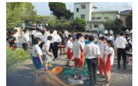
▲日田林工周辺等の清掃を行う大分県立日田林工高等学校生徒会（活動日：年3回程度）