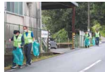
▲県道105号線山北日田線及び国道210号線の清掃活動を行う平山産業株式会社（活動日時：毎週木曜7:45～8:15）