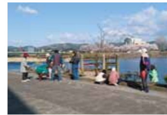
▲市道鏡坂銭淵線及び筑後川左岸の清掃を行う黒岩・台霧河川愛護会（活動日：毎月第1日曜日）

水郷のまちクリーンアップ制度（アダプトプログラム）とは、公共空間である道路や公園等に定められた一定区間を市民団体や企業等が清掃活動を行い、行政が支援する制度です。