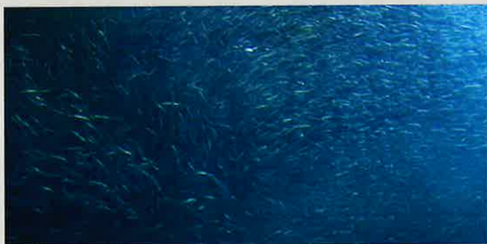
1階多目的ホール：UNEASINESS 17 岩澤有徑 芦谷正人 大澤辰男