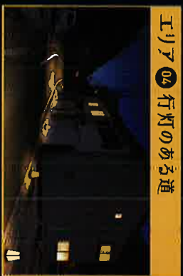
エリア04 行灯のある道