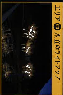
エリア03 木立のライトアップ