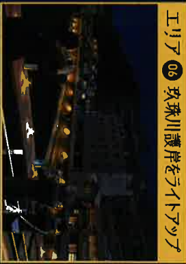
エリア06 珍珠川護岸をライトアップ

※ 駐車場については、市営赤岩湯駐車場、桜滝市営駐車場、天瀬温泉局駐車場をご利用ください。