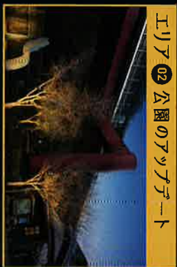
エリア02 公園のアツアツシート