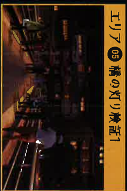
エリア05 橋の灯り検証1