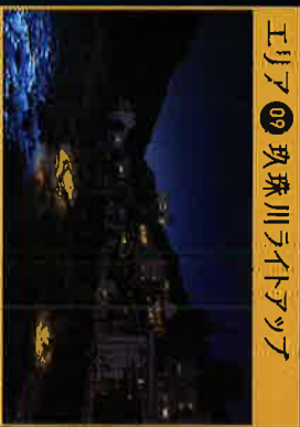
エリア09 珍珠川ライトアップ

川辺の散策や川の風景に護岸帯の灯りは重要です。上からの灯りや下から間接照明など複数の灯りを検討します。