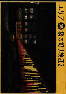
エリア08 橋の灯り検証2