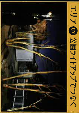
エリア07 公園ライトアップでつなぐ