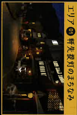
エリア01 軒先提灯のまちなみ

天ヶ瀬温泉街の被災後の街の暗さを払拭するために、9箇所の灯りスポットを設置し、「灯り」の実証実験を実施します。住民さん・観光客のみなさんの声をアンケートで集めます。皆さんの意見を反映させて、より良い街にしていきたいと思います！