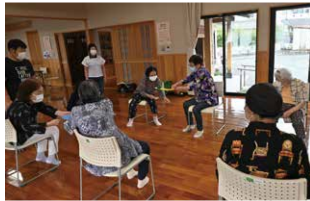
▲銭漕町「寄り合いサロン」の様子

「見守り」と言っていますが、特に一人暮らしの高齢者の人は生き生きとして活動的な人が多く、本当に素晴らしいと日々感じています。民生委員となったことで気付かされることが多いです。