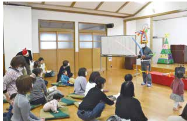
▲若宮公民館「子育てサロン」の様子

私の主な活動は、小学生の下校時の見守りや毎月若宮公民館で行っている子育てサロンの開催です。子育てサロンでは、子供たちはもちろんのこと、子育てするお母さんたちの憩いの場に少しでも