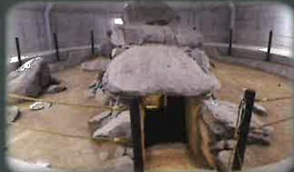
1号墳保存施設内部

直径 28.7m 程の円墳と推定され、埋葬施設は複室構造の横穴式石室です。玄室奥壁には、赤色の文様を緑色で縁取る技法により、両手を広げた人物・動物・船・飛鳥・円文などが描かれています。出土遺物には馬具や鉄鏃や耳環などの装身具が出土しており、6 世紀後半に築造されたと考えられます。