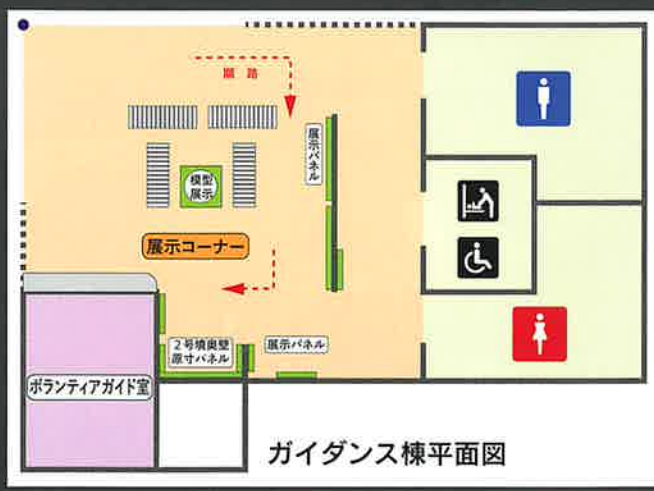
ガイダンス棟平面図