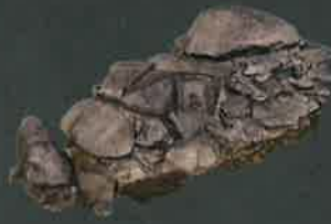
1号墳石室 VR 画像

史跡ガランドや古墳のガイダンス施設です。古墳の概要をパネルや模型で解説しています。また、解説動画や1・2号墳の石室 VR ビュー画像を閲覧できます。