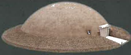
1号墳保存施設外観