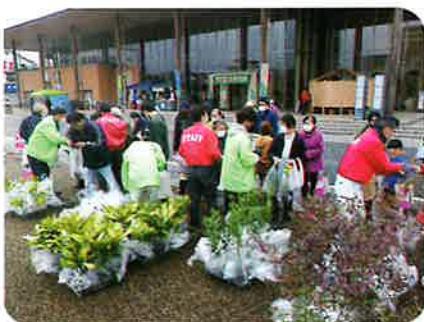
木と暮らしのフェア