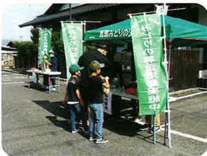
みどりの少年団募金活動