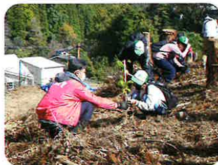
市民参加の森づくり大会