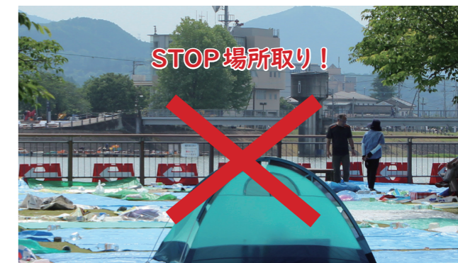
☎観光課観光振興係 ☎24 8210 (市役所3階)

河川敷や道路における悪質な場所取りは、河川法や道路法等に抵触する可能性があります。