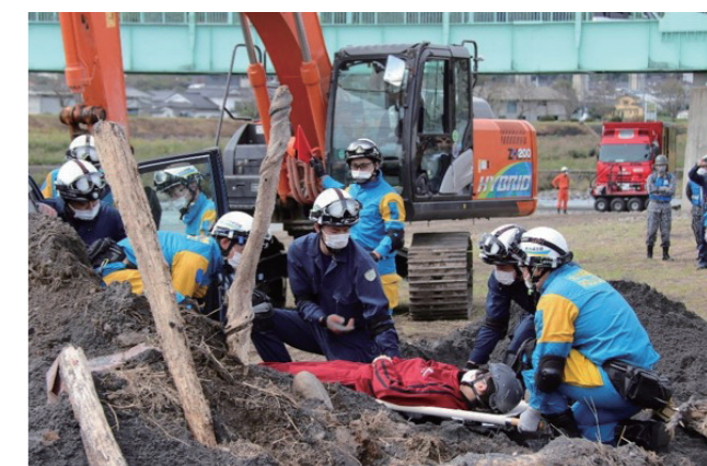
☎防災・危機管理課防災・危機管理係 ☎24 8363 (市役所4階)