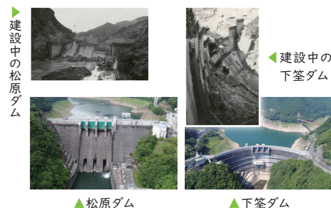
建設中の松原ダム

松原ダム・下笠ダムの管理50周年を記念して、ダム建設当時から現在まで、ご協力いただいた人たちに感謝を伝えるとともに、今後も大切な役割を担う松原ダム・下笠ダムが流域に愛されるよう、記念式典と記念イベントからなる感謝の集いを開催します。記念イベントでは、日頃見ることのできないダム内部の見学やステージ演奏などを企画していますので、是非お越しください。