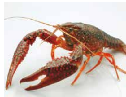
▲アメリカザリガニ

※販売や広く配布することを目的とした飼育等については原則、通常の特定外来生物と同様の規制がかかります。