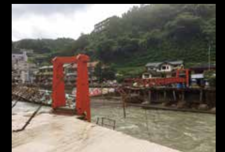
▲令和2年7月豪雨で被災した天瀬町