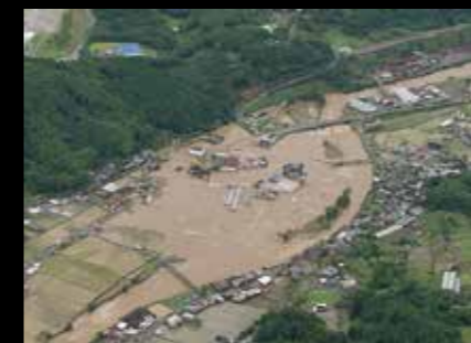
▲平成24年7月九州北部豪雨で被災した藤山町周辺