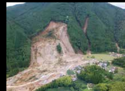
▲平成29年7月九州北部豪雨で被災した小野地区