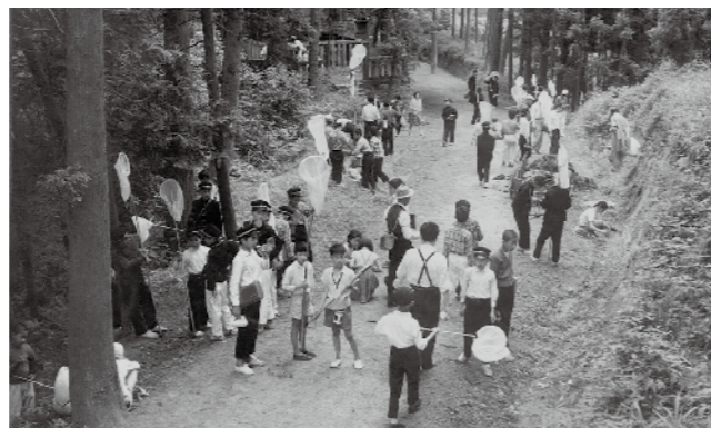
▲第1回植物昆虫採集会(昭和36年)の様子