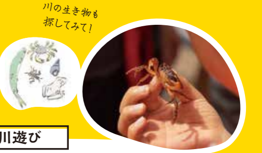
川の生き物も 探してみよう！