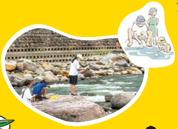
大人も子どもも みんなで川遊び！