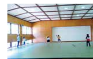
自由時間 宿題が終わったあとは自由時間！みんなでドッジボール楽しいな♪