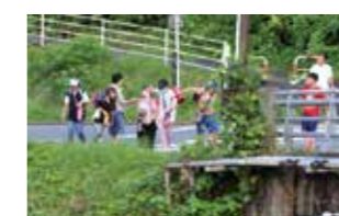
子供たち登所 児童が学校終わりに児童クラブに来るので職員で出迎えます。「ただいま」「おかえり」