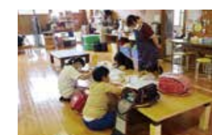
宿題 宿題を頑張っています。ひとつは終わるように頑張ろうね。