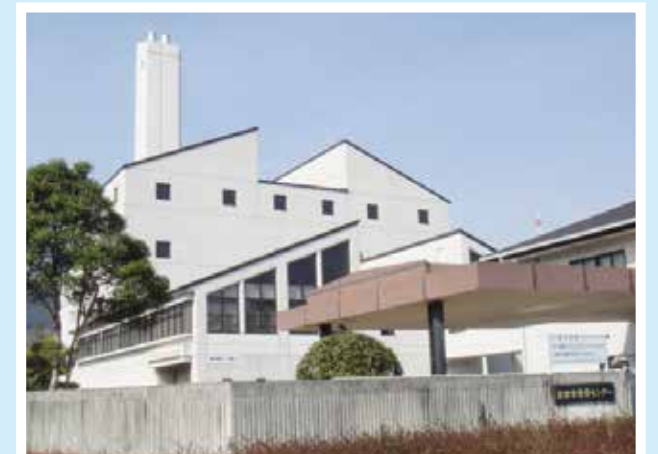
市清掃センター (緑町1丁目5番地1)

市民の利便性を高めることを目的に、毎月日曜開業日(基本的に第3日曜日)を設けていますので、ご利用ください。