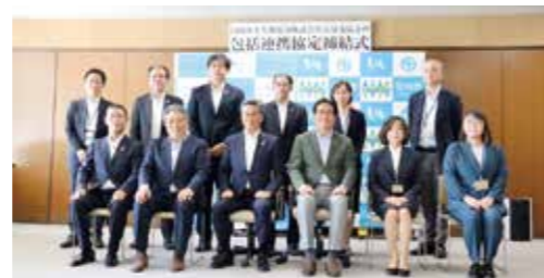
九州電力とカーボンニュートラル等に関する包括連携協定締結