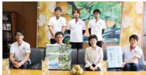
平成29年九州北部豪雨から6年。災害に強い新梨園地から本格出荷開始!!