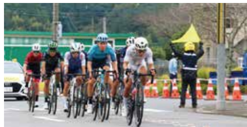
マイナビ ツール・ド・九州2023 大分ステージ