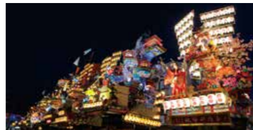
「日田祇園山鉾集団顔見世」初の週末開催