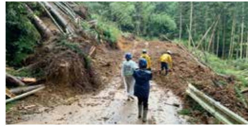
令和5年梅雨前線による大雨