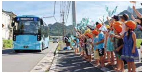
「日田彦山線BRTひこぼしライン」が開業