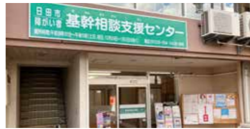
「日田市障がい者基幹相談支援センター」の開設