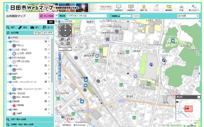
<公共施設マップ画面>

「日田市Webマップ」の運用を開始しました。 自宅やオフィスのパソコンからインターネット上で、 公共施設、ハザードマップ、都市計画情報、道路台帳図等の位置検索を簡単に行うことができます。 スマートフォンサイトもございますので、外出先からの検索も可能です。是非ご利用ください。