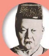
木曾町/長野県 山村蘇門

〒877-0012 大分県日田市淡窓 2-2-18 TEL 0973-22-0268