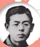
竹田市/大分県 瀧廉太郎