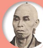
養父市/兵庫県 池田草庵