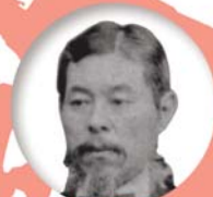
釜石市/岩手県 大島高任