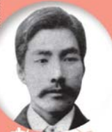
日田市/大分県 廣瀬淡窓