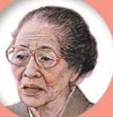
沖縄市/沖縄県 島マス