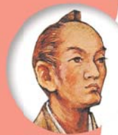
米沢市/山形県 上杉鷹山