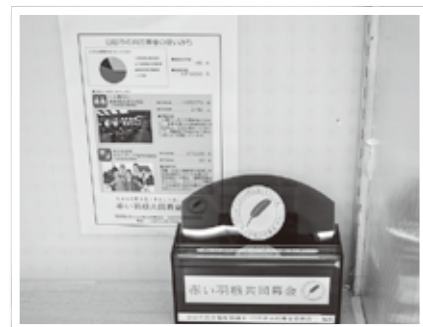
設置している募金箱