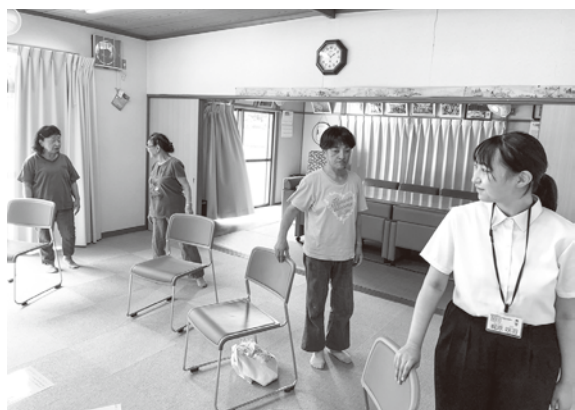
通いの場レクリエーションの様子

大学で学ぶなかで、社会福祉協議会では様々な事業を行っていることを知りましたが、実際にどのような運営し、地域住民と関わっているのかはイメージしにくいと感じていました。そのため、現場で学び理解を深めたいと思い、実習先に社会福祉協議会を選びました。