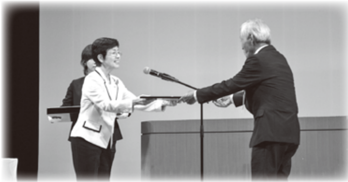
式典の様子 受賞者の皆様おめでとうございます

10月12日(日)パトリア日田及び中央公園を会場に、「市民健康福祉まつり」が開催されました。 式典では、日田市民の健康と福祉の増進に貢献した団体・個人に対し、その功績を讃え、表彰式典が行われました。午後からは市民公開講座「だれひとり取り残さない防災についてーインクルーシブ防災とはー」について講演がありました。障がい者、高齢者、外国人など、誰もが災害から取り残されないようにするための考え方について学ぶ内容でした。