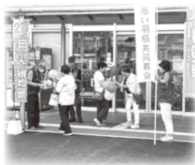
街頭募金活動の様子

年末にかけて地域のお祭りやイベントで、学生や団体などのボランティアによる街頭募金活動が行われます。また、商業施設などに募金箱を設置させていただきました。お見かけの際は、ご協力をお願い致します。