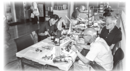
ひたおもちゃ病院が開院 壊れたおもちゃを治療(修理)