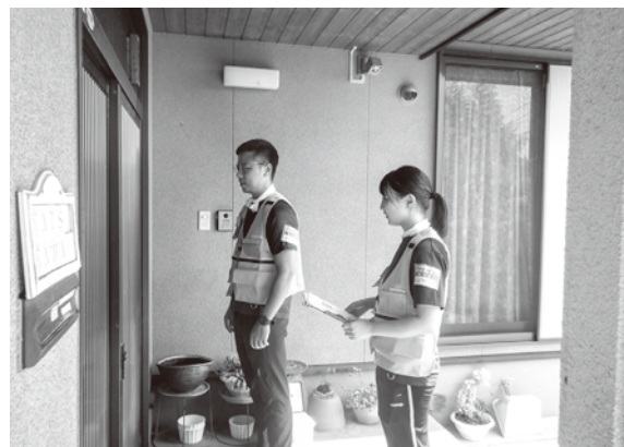
災害ボランティアニーズ調査(熊本県玉名市)

今回の実習で特に印象に残ったことは、各地区の通いの場に参加したことです。地区ごとに利用状況や取り組みの内容が異なり、その多様さに驚きました。その中で、実際に移動支援の様子を見学できたことも貴重な経験になりました。また、社協が運営する、こども園やデイサービスでは、ご利用者の方々と関わる機会があり、専門職としての関わり方について考えるきっかけになりました。災害ボランティアでは、災害ボランティアセンターの運営の大切さを学ぶとともに、日田市での災害支援や対策についても知ることができました。